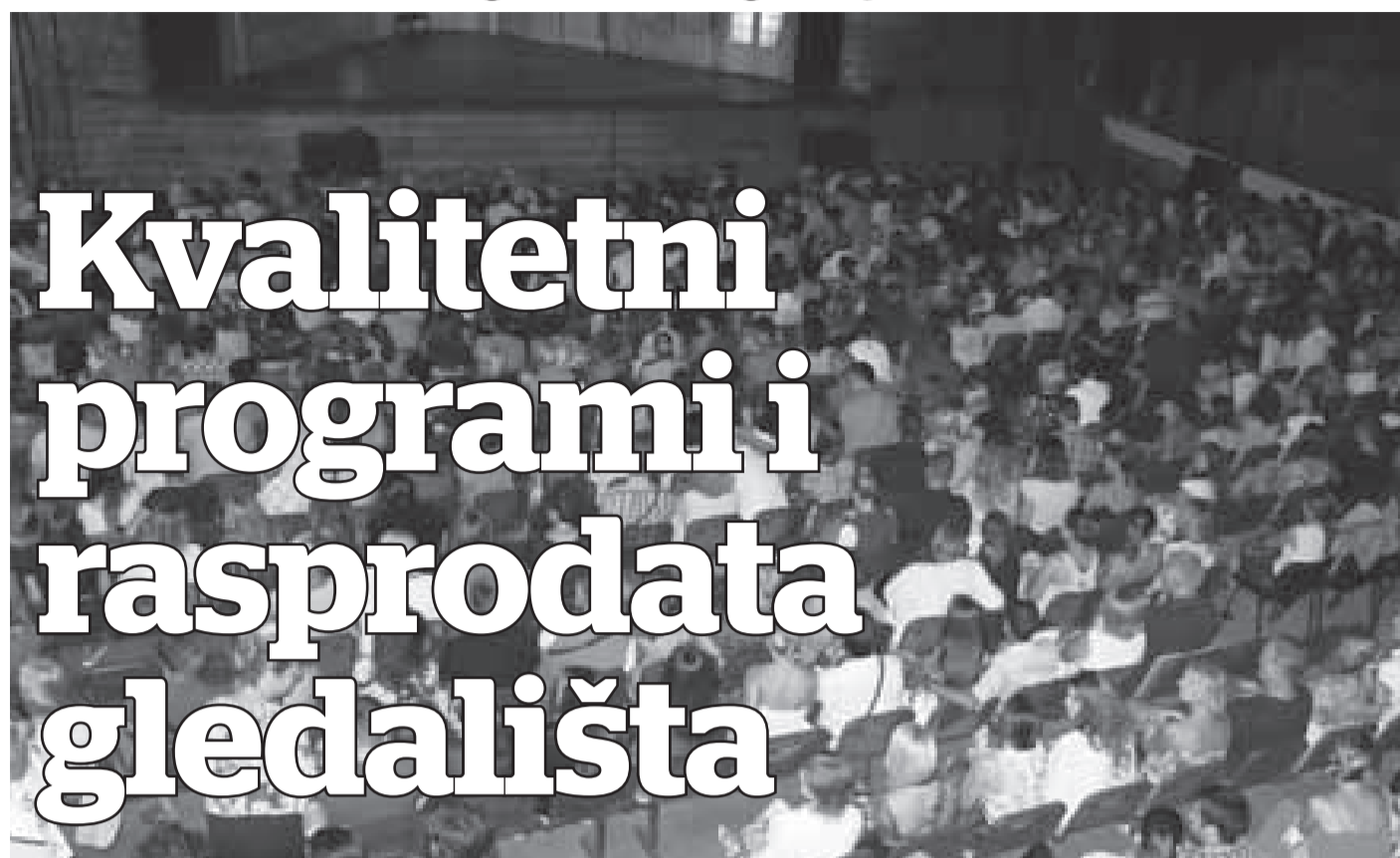
OGROMNO INTERESOVANJE ZA „PURGATORIJE“: Ljetnja pozornica u Tivtu

U atrijumu Ljetnikovca Buća-Luković gužve su bile uobičajene, često se tražila karta više, ali tražnji nije mogla odgovoriti i ponuda. Veliko interesovanje vladalo je za sve segmente umjetničke ponude